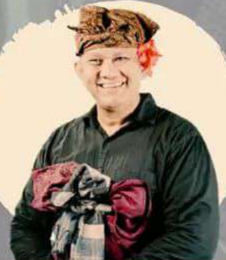
BAYU PRAMANA @bayu.lingkar