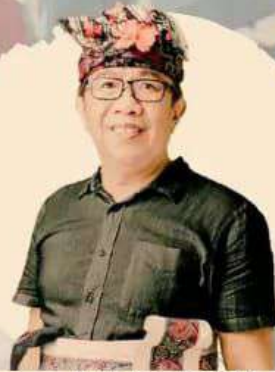
ANDI SUCIRTA @andisucirta