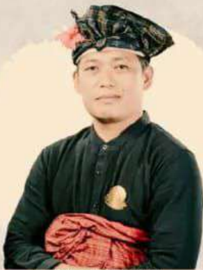
I MADE DANA @imadedana

Pemerintah Kota Denpasar Kecamatan Denpasar Utara